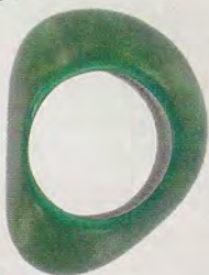
Bague Taguanita Émeraude, 18 €