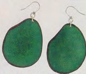
Boucles d'oreilles Unihosty, 12 €